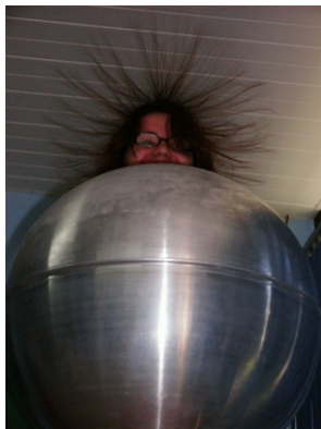
Figura 3 - Efeito Físico do Gerador de Van de Graaf