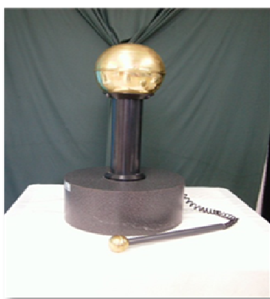
Figura 1 - Gerador

O terminal pode atingir um potencial de vários milhões de Volts, no caso dos grandes geradores utilizados para experiências de física atômica, ou até centenas de milhares de Volts nos pequenos geradores utilizados para demonstrações nos laboratórios de ensino.